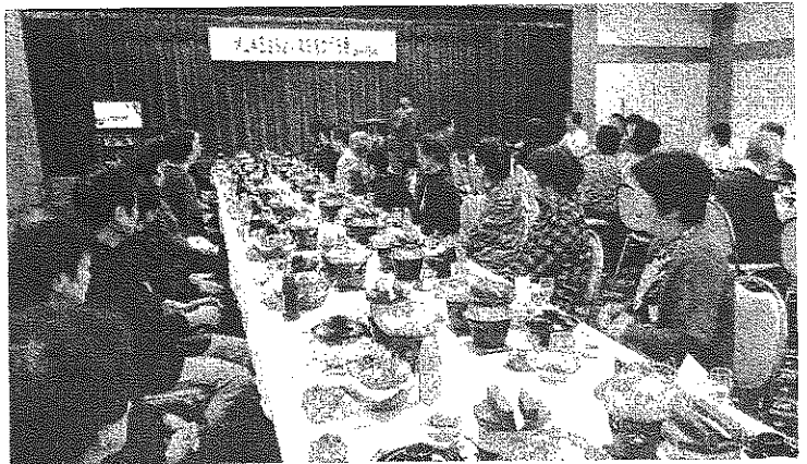
「美味しいそうなお菓子ね」「たこの釜めし、珍しいわ」「さつま芋のプリンも甘くて良いわ」と会話も弾みます