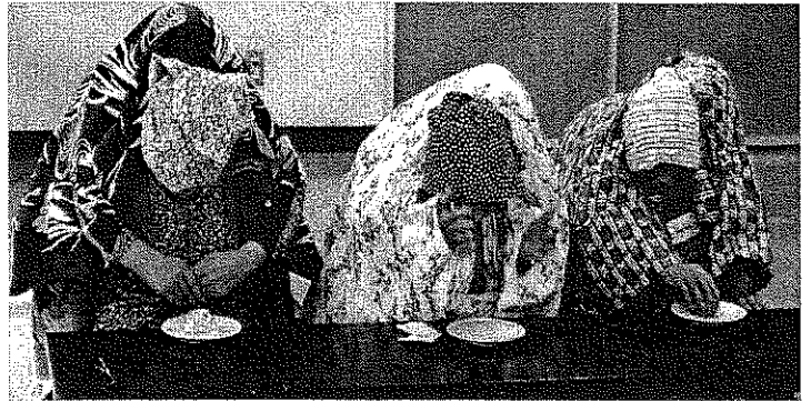
12/27 木曜サロンで披露した二人羽織り

平成最後という時代の移り変わりをとおして、高齢者の皆さんが季節の行事や地域の慣わしなどを若い世代に伝えることは、とても素敵で重要な役目ですね。