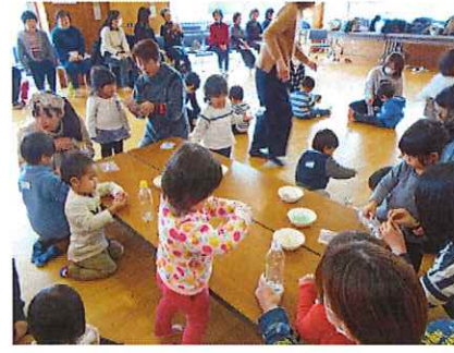
↑ペットボトルでおもちゃ作り - 完成！