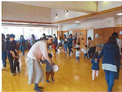
↑タンブリンを打ちながら♪「さんぼ」の曲に合わせて↑お芋ほりごっこ