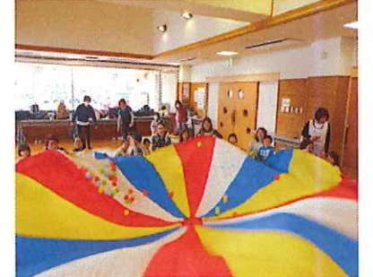
↑バルーンでボールをポンポン！曲はU.S.A