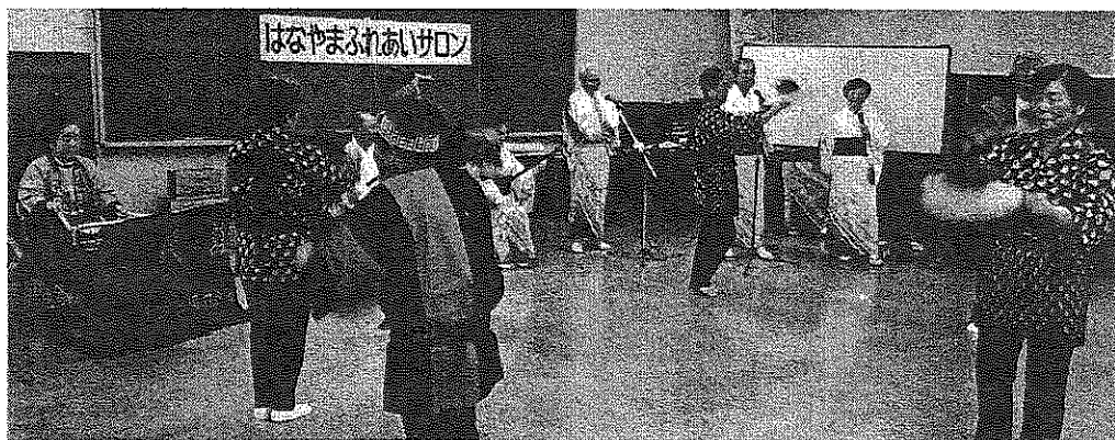
日立会民謡部の皆さんに、元気をいただきました

日立会の皆さんの歌や踊りが、心を打つのは、伝統や絆を大切に長年一緒に活動しているからこそと実感しました。「お互いに元気で頑張りましょう」と来年の再演を約束して会は終了しました。