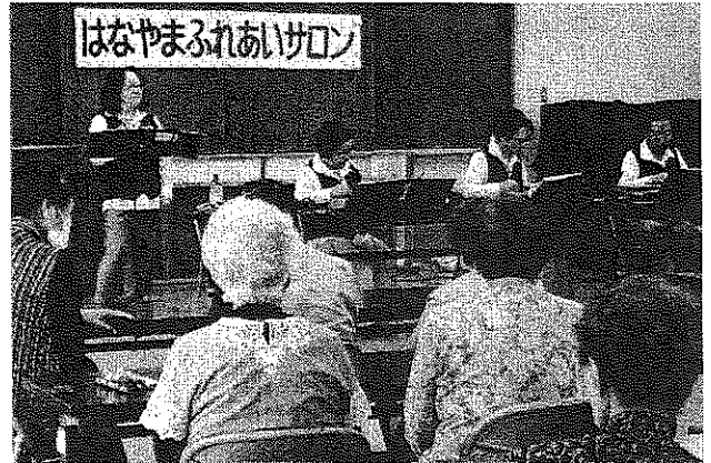
4/25 木曜サロンの大正琴演奏会 昭和の懐かしい歌を楽しみました

そのためにも、健康に注意して元気で暮らしていきましょう。木曜サロンでは、健康講話や詐欺被害防止の講話など高齢者に役立つ内容も実施しています。興味のある方や参加希望の方は、気軽に塙山交流センターまでお電話ください。(☎34-5431)