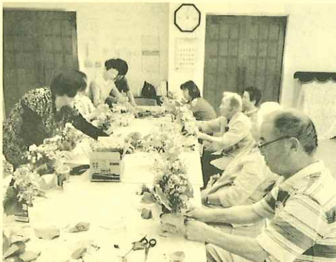
思い思いにフラワーアレンジメントを楽しむみなさん

おしゃべりサロンの行事の中から6月14日(金)のフラワーアレンジメントをご紹介します