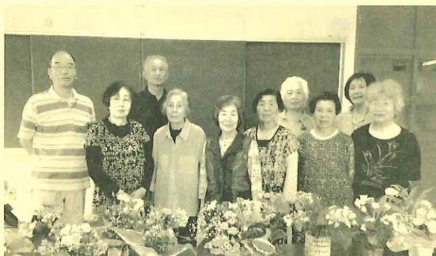
参加者のみなさんです

す。この日は16名が参加しました。参加者が自分の庭の草花を持ち寄り、これに用意したカスミ草などを加えてフラワーアレンジメント(次頁へ)