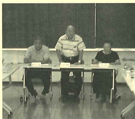
挨拶する地区社協会長

な高齢者の方の変わりがないかの確認をし、次に日立市の「成年後見サポートセンター」と「自立相談サポートセンター」の開設についての説明がありました。その後「あんしん・安全ネットワーク強化モデル事業」と「軽度作業支援事