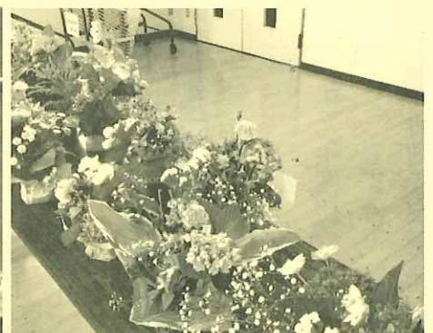
見事なフラワーアレンジメント