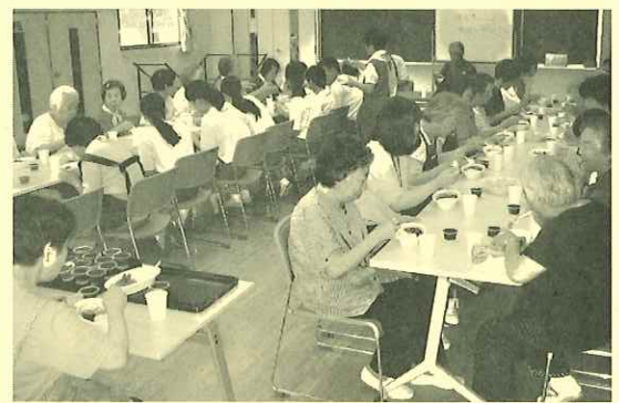
お茶会、みなでおいしいカレーをいただきました

す。この日は16名が参加しました。参加者が自分の庭の草花を持ち寄り、これに用意したカスミ草などを加えてフラワーアレンジメント(次頁へ)