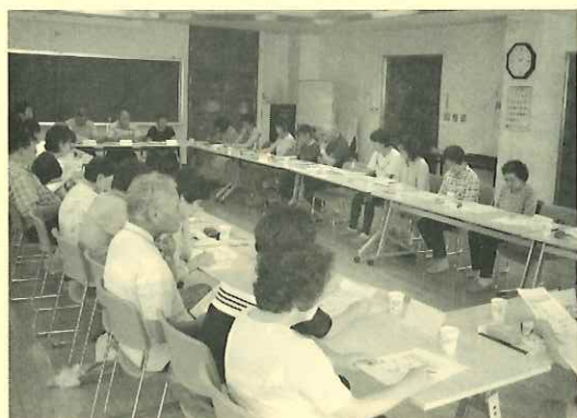
出席したキーパーソン