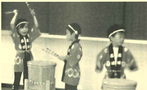
可愛い園児が太鼓をたたいてくれました