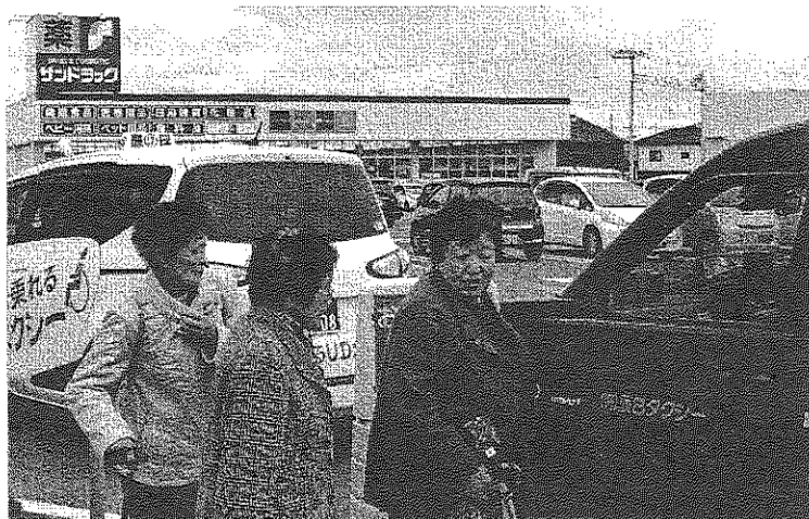
12/26は相乗りタクシーを利用して、買い物ツアーを実施。河原子のヨークタウンに出かけました

これからますます寒くなりますが、暖かい交流センターで簡単な体操で体を動かしたり、大声で歌ったりして元気いっぱい的一年にしましょう。どうぞ皆さん、お友達と一緒にお願いします。