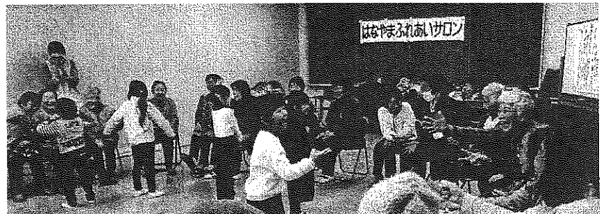
1/23 笑顔に包まれた塙山幼稚園の園児との交流会