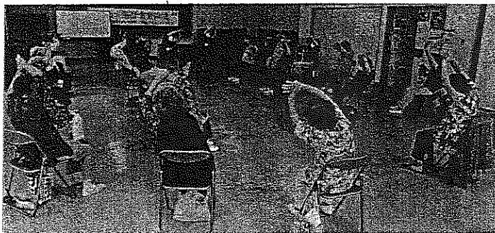
7/2 4か月ぶりに木曜サロンを再開しました

今年はコロナの影響で、恒例のさんさん祭りやはなやま敬老会も中止になりました。残念ですが、一番大切なのは命です。今は辛抱、みんなで乗り越えましょう。コロナに負けるな！