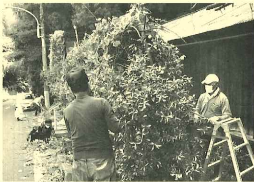
すっかりきれいになりました

仲町地区社協の事業の一環で（小さなおたすけたい）として2018年からあんしん・安全ネットワークチームに入っている方を対象に実施しております。作業時間は約3時間ほどで、簡単なお庭の草取りや、お部屋の片付け等を民生委員をはじめ、地域のボランティアの協力で行っております。今までに5名のかたのお宅にお邪魔して作業をしております。費用はゴミ処理代、軽トラック代1000円