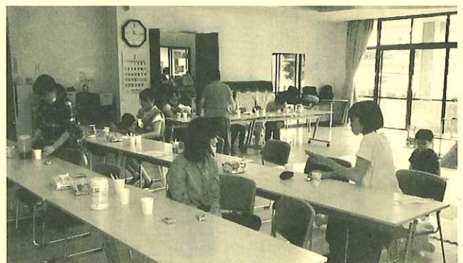
お母さんの交流会もあります