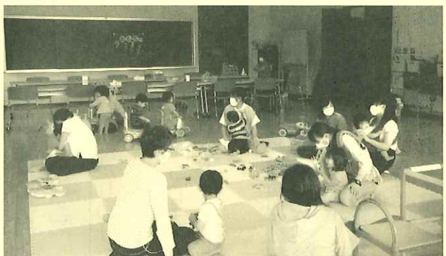
元気に遊ぶ子どもたち