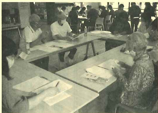
情報交換が主体です

仲町学区も高齢化が一段と進み、これから益々地域の方の見守りや支援が必要となつてまいります。ご近所の高齢