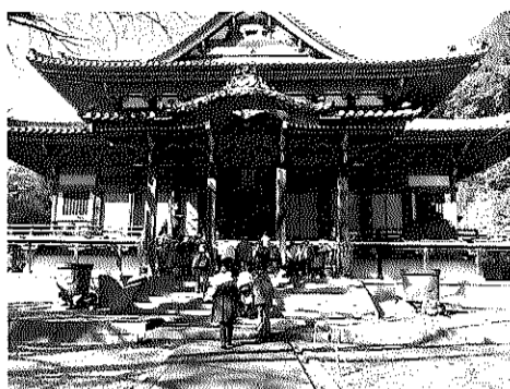
稲田禅房西念寺でお参り

笠間市の石の百年館は、埴山地区を中心にとれる稲田石について学び、磯蔵酒造では、酒蔵の見学と、稲田石でろ過されたきれいな水で作ったおいしいお酒を試飲。その後、浄土真宗関東布教の地である「稲田禅房西念寺」の本堂にお参り、紅葉の素