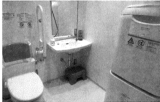
みんなのトイレにはおむつの交換台も設置

八月初めから始まった埴山交流センターのトイレ改修工事がほぼ終了し、十一月末日には男子、女子、みんなのトイレがバリアフリーになり、清潔で明るいトイレに改修されました。