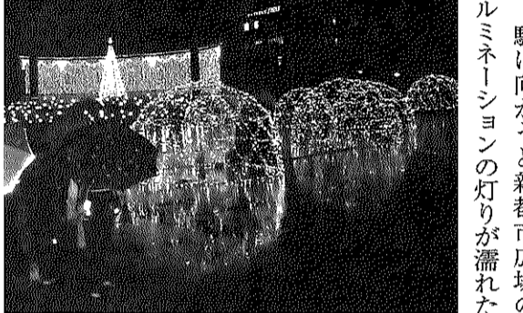
雨に映るイルミネーション

※1回のみ参加もできます ※新型コロナウイルスの感染状況によって、教室日程が変更・中止になる場合もあります