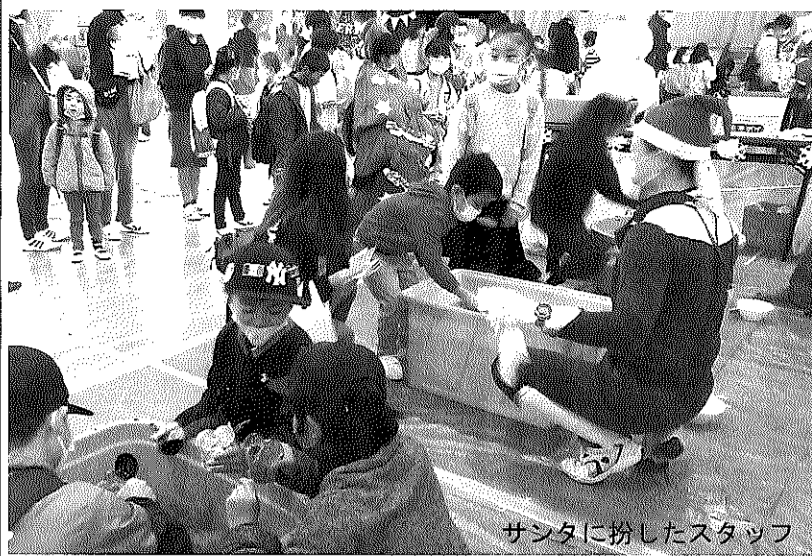
サンタに扮したスタッフ

塙山学区初のイベントとなった「はなやま子ども祭り」が十二月四日(土)、塙山小体育館で開催されました。このイベントは、新型コロナウイルス感染症の影響で二年連続「学区最大の祭りである「さんさん祭り」など子どもたちが楽し