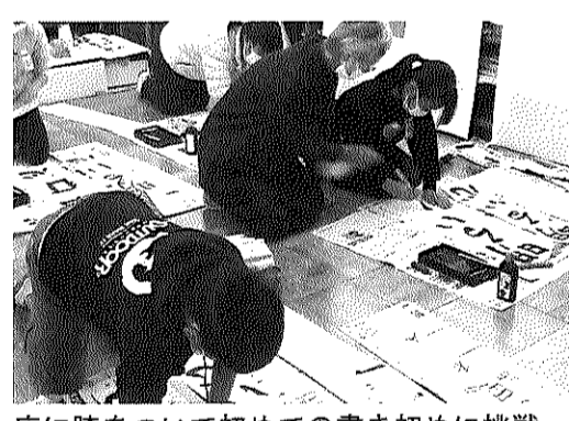
床に膝をついて初めての書き初めに挑戦

毛筆での書き初め初挑戦となる三年生は、用紙の大きさや置き方、膝をついて書くなど、ほとんどの児童が今まで経験したことがないため、始めこそ四苦八苦していましたが、徐々に慣れて課題の「明るい心」を書き上げていました。冬休みにも家庭で練習を重ね、一月の本番に備えます。体育館で学年一斉に行う書き初め会が楽しみです。