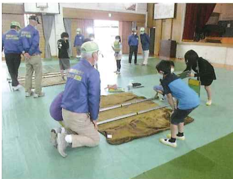
【5/22 学区防災研修 4年生の防災授業】

コミュニティ活動は、新型コロナウイルス感染症拡大防止のために「定期総会」「海岸清掃」「三世代敬老の集い」「おおせ秋まつり」その他、専門部の事業、行事など中止になりました。新型コロナウイルス感染症拡大防止対策をとりながら行われた活動の一例を紹介します。