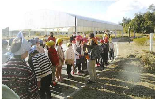
【11/14 元気っ子いわき震災伝承みらい館へ語り部から震災当日、復興の話を聞く】