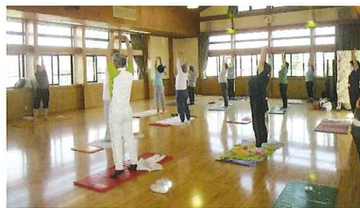
【健康づくり部の活動 令和4年度会員募集中】