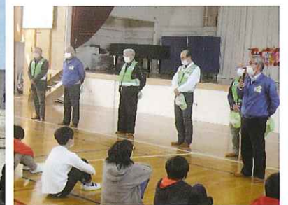
【3/7 防犯サポーターへ感謝の会】