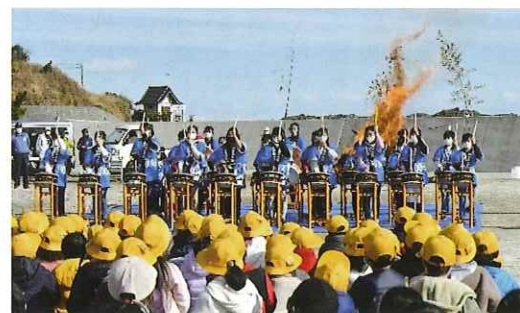
【1/15 浜の焚きあげ祭浜太鼓披露】