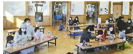
【親子教室ひよこ・ちびっこ】