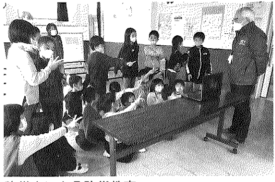
防災士による防災教室

三月二十五日から四月五日までの春休みの期間中、二十五名の児童が参加、毎日七名の指導者が二交代で対応しました。子どもたちは毎日、楽しいプログラムで過ごしました。