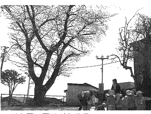
こども園の園児がお花見に

予想より開花が遅れた塙山交流センター中庭の桜の花を、地域のみなさんに楽しんでもらおうと、四月一日から十六日まで開放しました。気軽に立ち寄り、お花見に引き寄せよう、時々、新