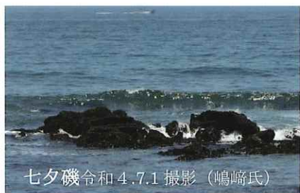
七夕磯令和4.7.1