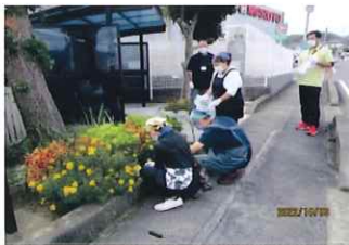
バス停前をきれいにさせていただきました