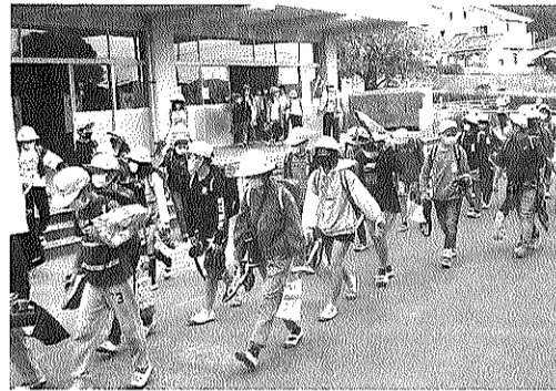
校庭に避難する児童

六年生は体育館で防災備蓄倉庫から機材の持ち出し、感染防止パーティションや段ボールベッド組み立て、簡易トイレ設置などの感染防止避難所開設を体験