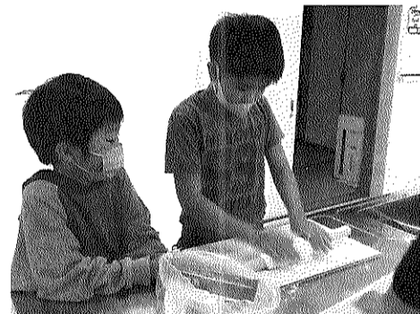
うどんの生地をていねいに伸ばして

十月十七日(月)は、塙山学区防災訓練の振替休日、昼食はうどん打ちに挑戦。生地を足で踏んでコシを出し、伸ばした生地を切り分け、うどんの汁づくりは、三年生が中心に行いました。 おやつは手作りクッキー。残り家族へのお土産に、嬉しそうに持ち帰りました。