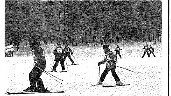
スイスイ滑れるようになりました

施設に到着後、入浴や買い物など、各々の時間を過ごし、昼食は、海見える食事処で、新鮮