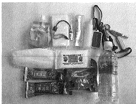
住民の方がいつも携帯している防災グッズを紹介

一週間は自力で生活できる備蓄品を日頃から準備しましょう。非常持ち出し品は各人がとつぎの時に持ち出せるようリュック