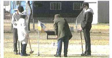
【グラウンドゴルフ大会 2/5 に開催 PON 友会・おやじネットワーク・青年会の協力で3世代が楽しくプレー】