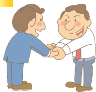
ようこそ桐生市へ