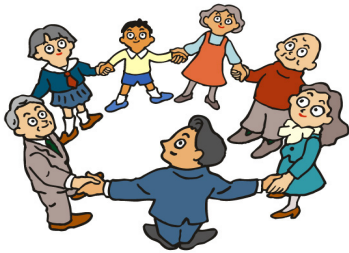
地域で手を組もう

水木学区社協は、水木交流センターを拠点として、学区内に居住する住民が主体となって、地域でだれもが安心して暮らせる街づくりを目指して、支え合える仲間を作りながら楽しく活動しています。皆様、気軽にご参加ください。