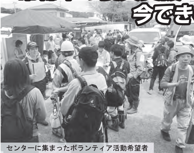
センターに集まったボランティア活動希望者