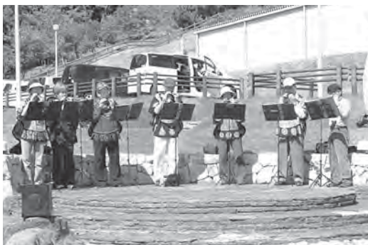
心地よいオカリナの音色が砂浜に響きました

清掃のあと、鵜の岬公園内を散策。交流会では「グループ・ピニオン」によるオカリナ演奏会を楽しみました。優しい音色が周辺に響き渡り、参加者の交流を図るよい機会となりました。