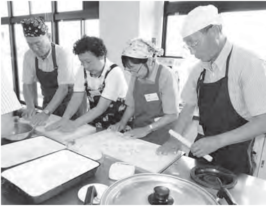
参加者もスタッフも一緒になって餃子づくり

2回目以降は、ボランティア活動の楽しさや老いへの心構えについての講話、市内巡りや餃子づくりの交流会など、受講者とスタッフが交流を図りながら実施しました。