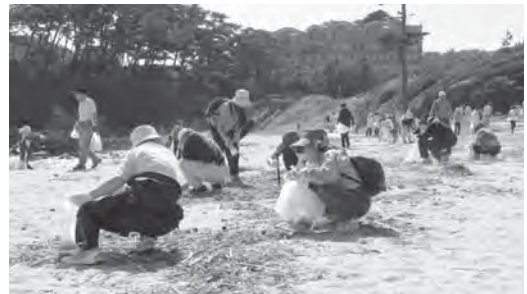
美しい砂浜をめざしてゴミ拾い

短い時間の中で、協力して拾い集めた結果、ペットボトルや金属片など予想以上のゴミが回収され、あっという間に美しい砂浜になりました。