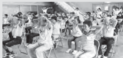
健康アップ推進事業での肩こり予防の体操

趣味や地域での活動に積極的に参加し、いつまでも元気な毎を送りましょう！ 興味や関心のあるかたは、市社協（TEL 37-1122）までお問い合わせください。