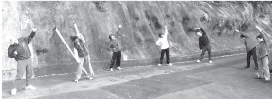
朝一番のラジオ体操で心も体もリフレッシュ

成沢地区では現在、山の神団地、青葉台団地、堂平団地の3か所で毎朝「ラジオ体操」を行っています。夏休み期間中は多くの地区で子どもたちが中心となり体操を行っていますが、年間を通して地域住民が主体となる活動は数少ない取り組みの一つです。