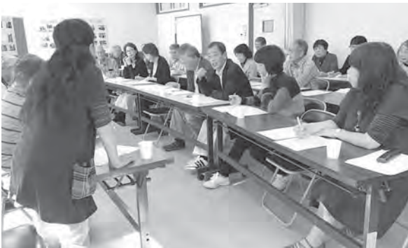
豊浦地区との研修交流の様子

日立市は23の小学校区ごとに福祉活動を進めています。そのうちの1つである宮田地区は今回、市内の実践地区である豊浦・諏訪地区との研修交流会を行いました。