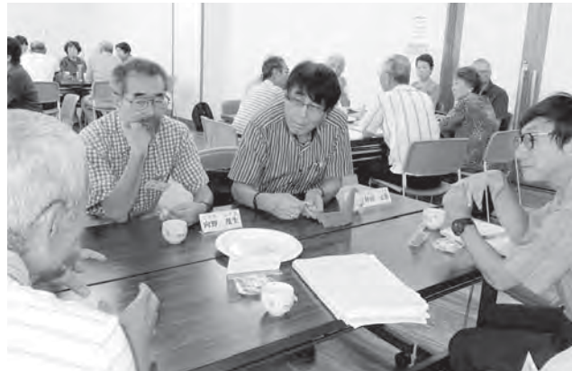
「井戸端会議」では、生きがいづくりの話題でもちきりです