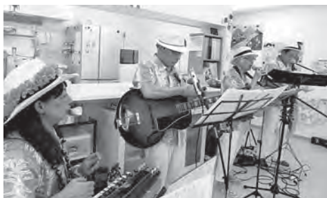
アロハ・ヒタチ （デイサービスでの演奏の様子）

日立市社会福祉協議会（ひたちボランティアプラザ）は、ボランティアに関する様々な相談窓口です。 ぜひ、お電話ください。（TEL37-1122）